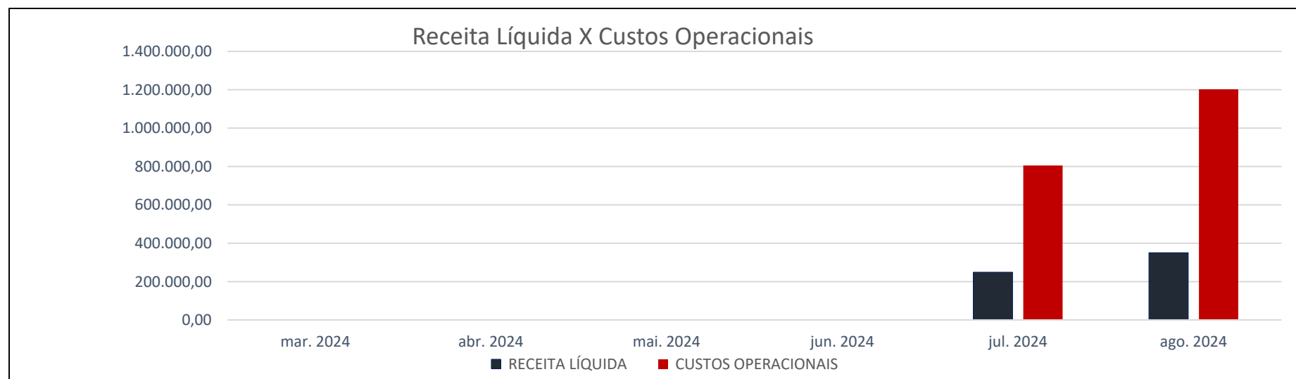
Gráfico 3- Receita líquida x Custos operacionais

O Gráfico 3 apresenta os valores da Receita Líquida e dos Custos Operacionais entre os meses de março e agosto de 2024.