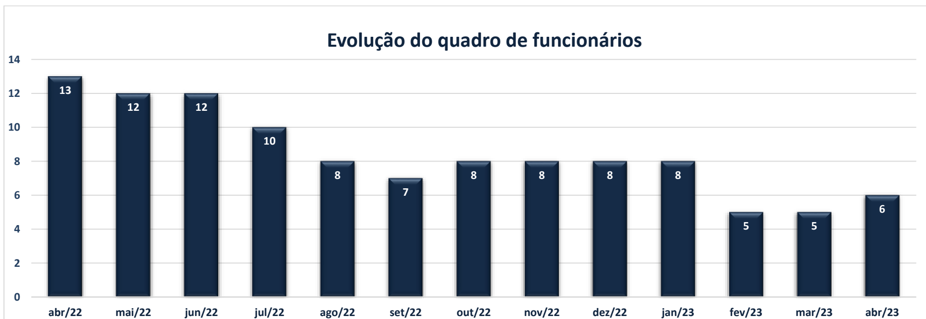
Gráfico 1 – Evolução do quadro de colaboradores